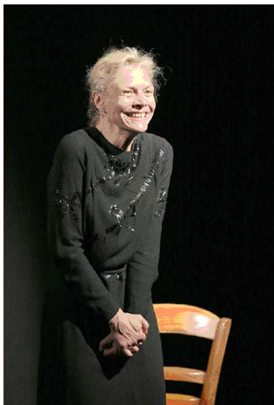
«Monsieur Proust» mise en scène Ivan Morane avec Céline Samie