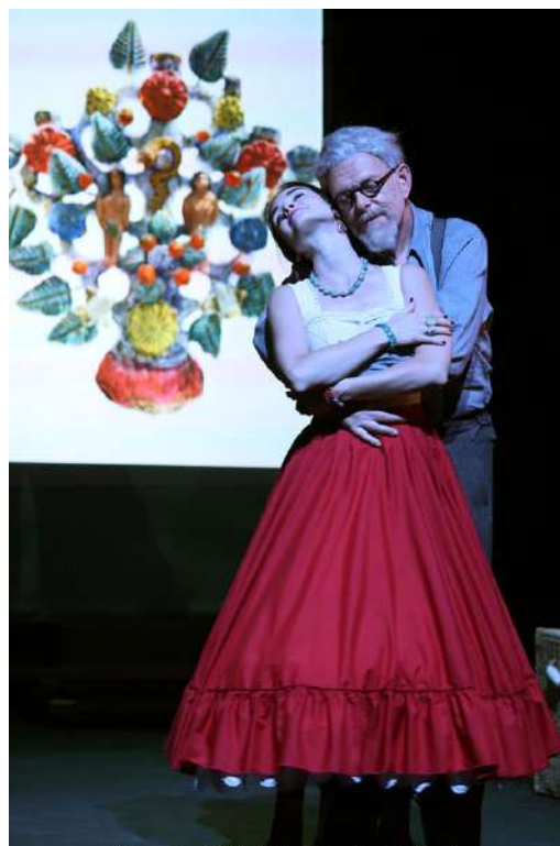
"Un amour de Frida Kahlo"