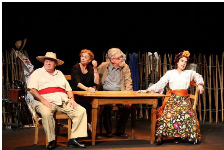
"Un amour de Frida Kahlo" * mention obligatoire Photo Lot

Province : 5 500,00 € HT hors transport (camionnette + troupe) et défraiement pour 7 personnes au départ de Paris